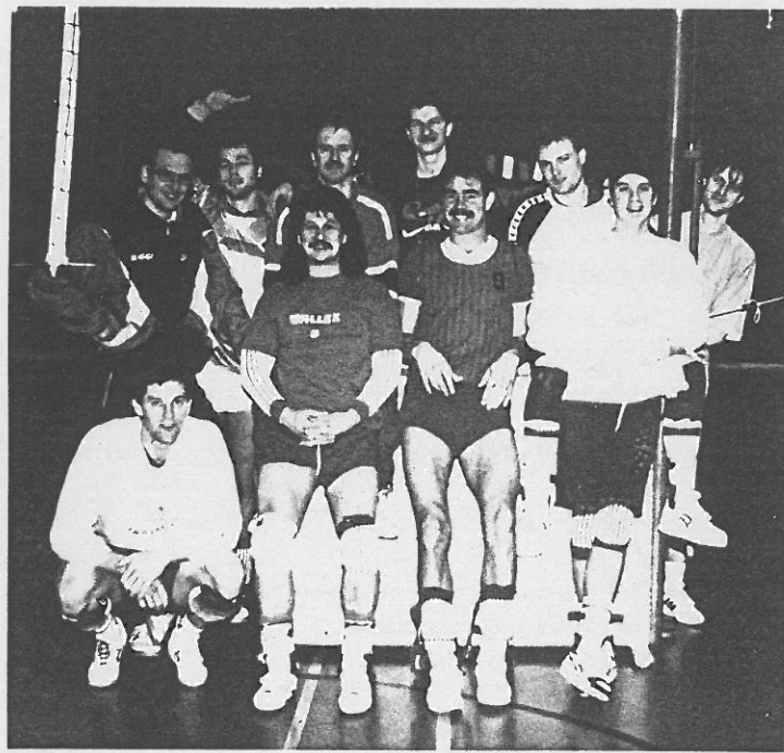
Holten 12:0 Punkte seit dem Januar-Trainingslager in Westerstedt wo dieses Bild der 1. Herren des S.V. GW Vallstedt entstand